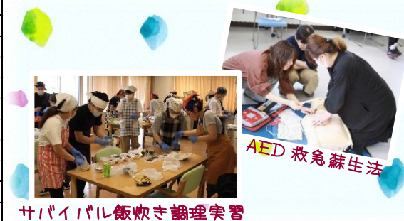
サバイバル飯炊き調理実習