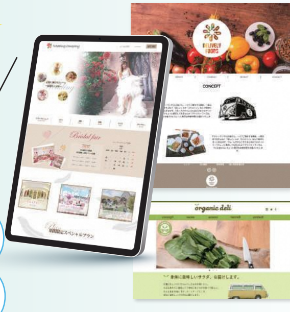
掲載作品は、全て過去の訓練生作品

企業実習を経験して仕事内容を知りたい! 就職前に、業界や職種について知るチャンス!