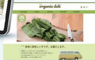
掲載作品は、全て過去の訓練生作品