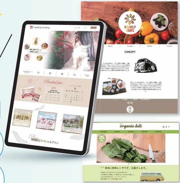
掲載作品は、全て過去の訓練生作品

企業実習を経験して仕事内容を知りたい! 就職前に、業界や職種について知るチャンス!