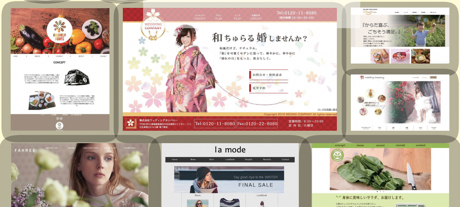
掲載作品は、全て過去の受講生作品