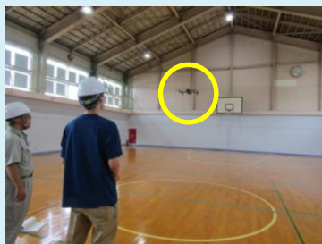
建物調査(ドローン飛行練習)