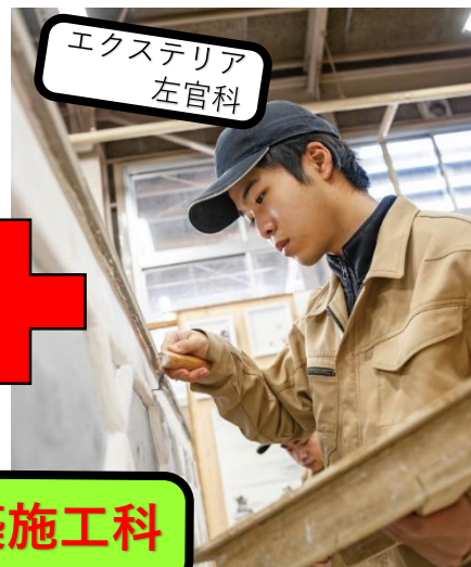
エクステリア 左官科