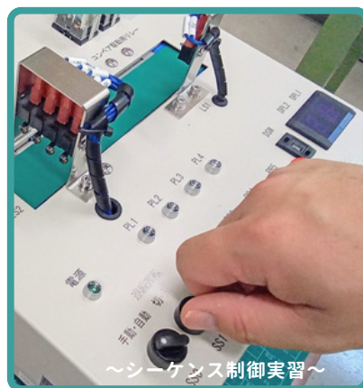
～シーケンス制御実習～