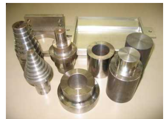
NC工作機械で加工した製品

訓練受講前にハローワークでキャリア・コンサルティングを受けて、 ジョブ・カードの交付を受ける必要があります。 応募者が少ない場合、やむを得ず訓練を中止する場合があります。