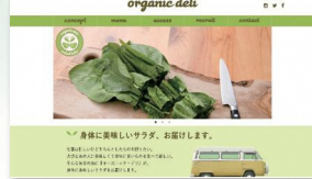
掲載作品は、全て過去の訓練生作品