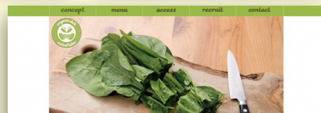
掲載作品は、全て過去の受講生作品