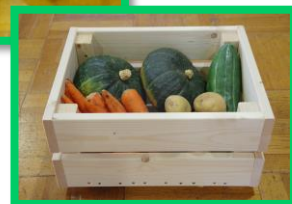
※写真は完成イメージ(野菜なし)です。