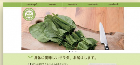
掲載作品は、全て過去の受講生作品