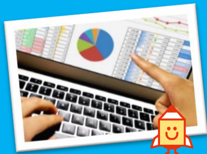
ハロートレーニング 魚がぼ学べ