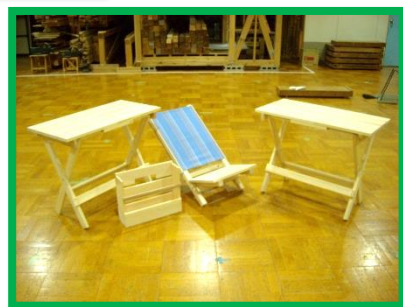
★7月の受講生が実際に作成した作品です。