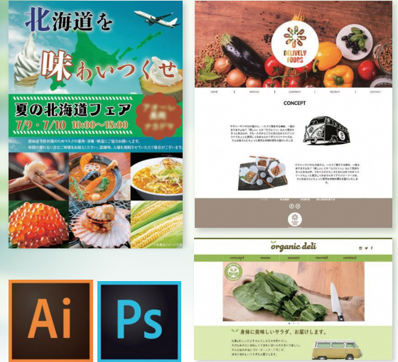
掲載作品は、全て過去の訓練生作品