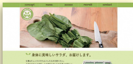
掲載作品は、全て過去の受講生作品