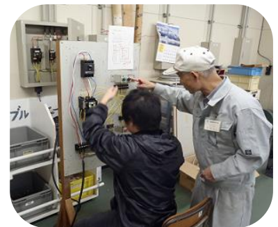
シーケンス制御配線作業